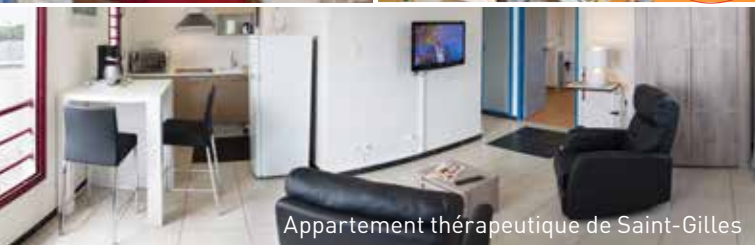
Appartement thérapeutique de Saint-Gilles