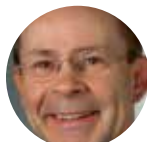
Pr Pierre CONORT